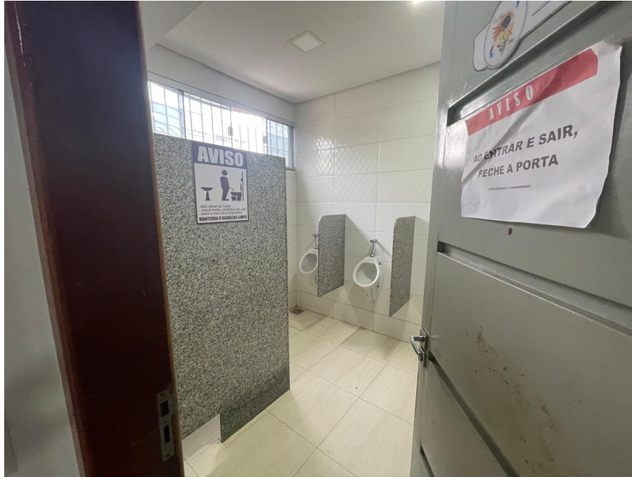
IMAGEM 6: SANITÁRIOS MASCULINO