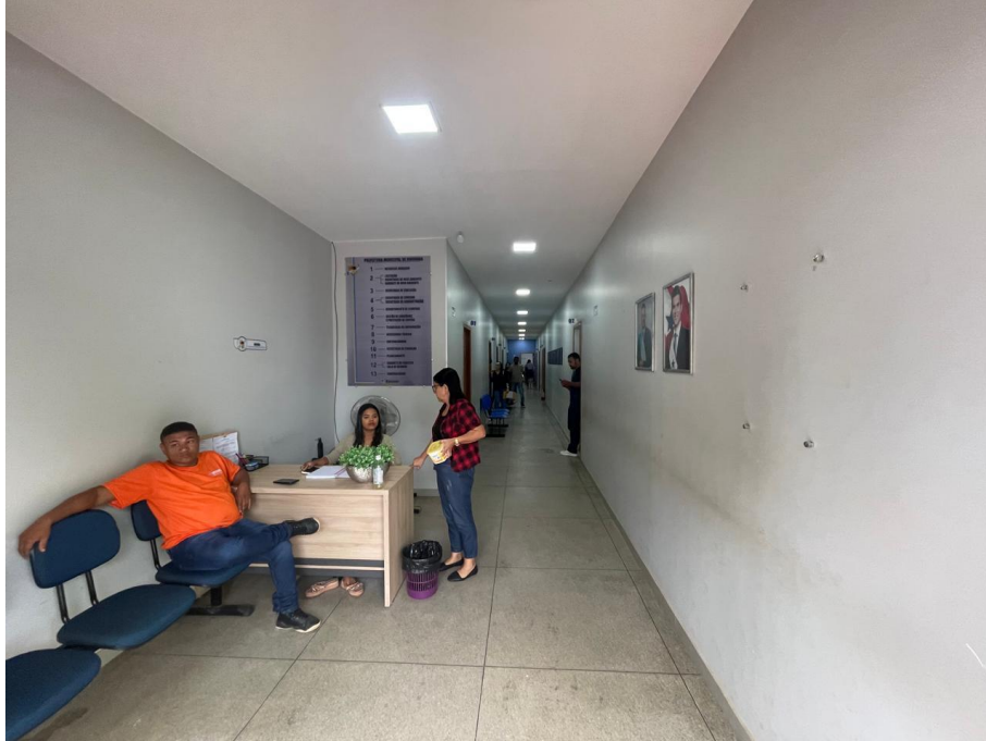
IMAGEM 4: VISTA ANTERIOR DA EDIFICAÇÃO