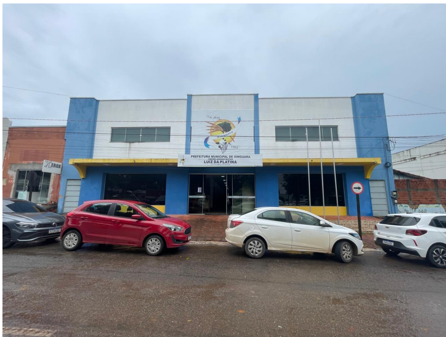
IMAGEM 3: VISTA FRONTAL DO ESTABELECIMENTO