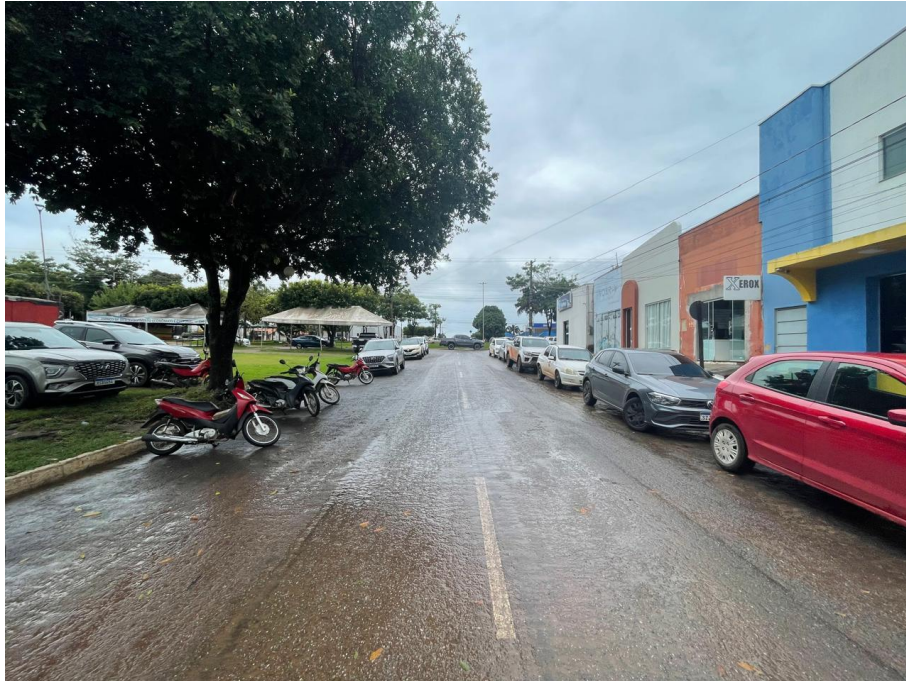
IMAGEM 2: VISTA LATERAL ESQUERDA À EDIFICAÇÃO