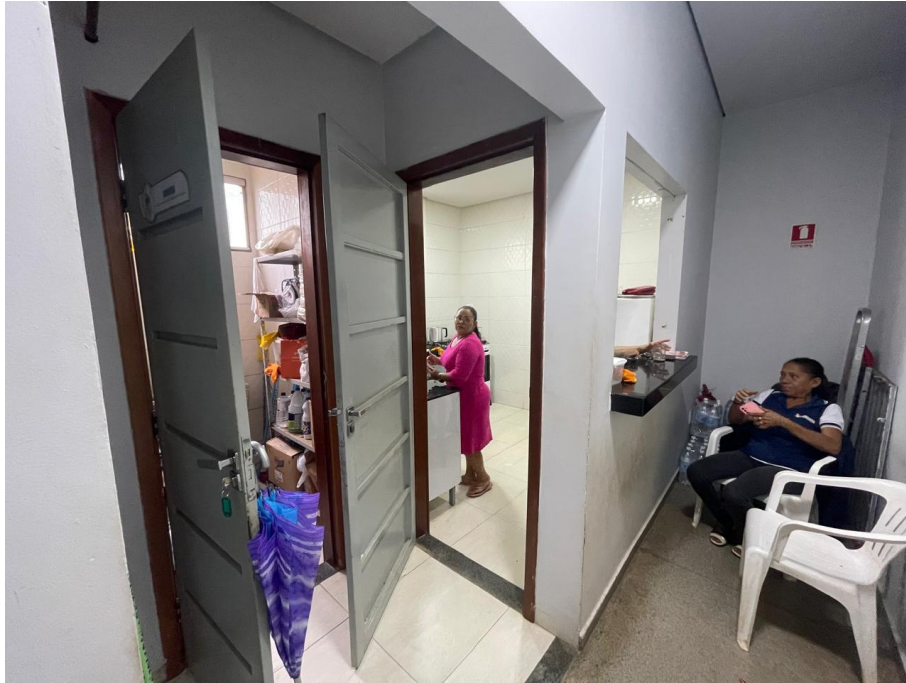
IMAGEM 8: COPA E DEPÓSITO