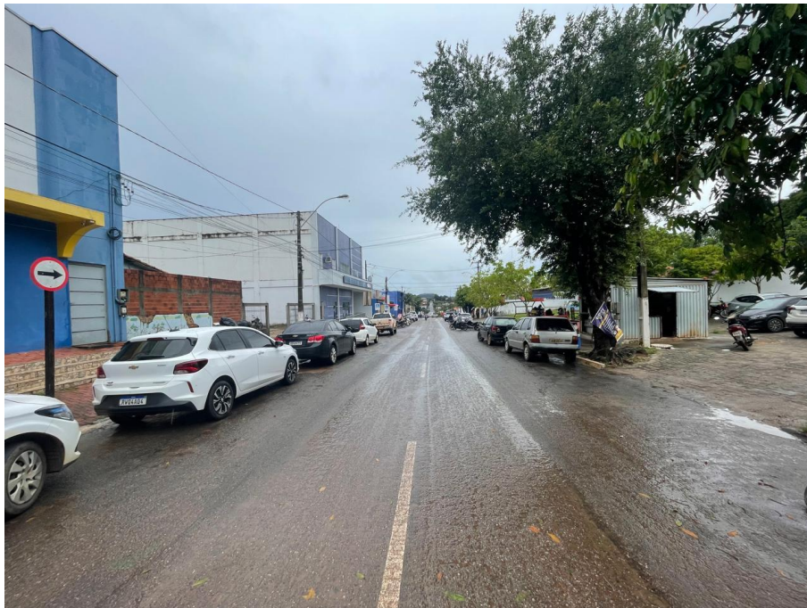
IMAGEM 1: VISTA LATERAL DIREITA À EDIFICAÇÃO

Abaixo mostramos algumas fotos da edificação, para identificar algumas características da mesma. Não encontramos nada que possa comprometer o habite-se imediato.