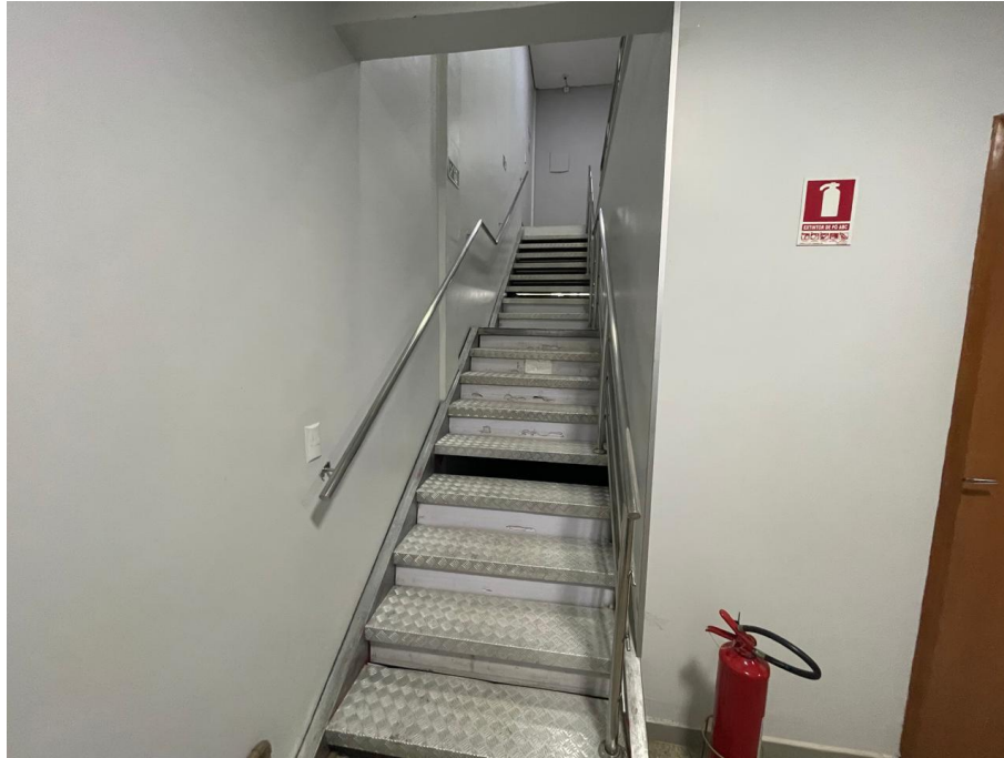
IMAGEM 10: ESCADA DE ACESSO À SALA DO GABINETE DO PREFEITO