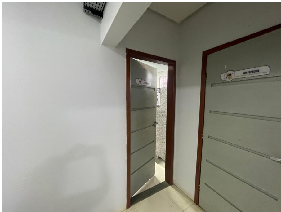
IMAGEM 9: SANITÁRIO FEMININO